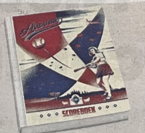
foto is er dus niet. Das: „Maar er is wel een overeenkomst. Moorfielders had bij de oprichting een bepalende vrouw in de persoon van softbalster Yvonne Boode.”

■ De club werd opgericht in 1980. Een directe link met de